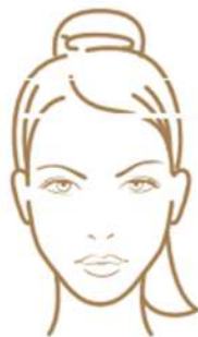
Pratique sur modèle